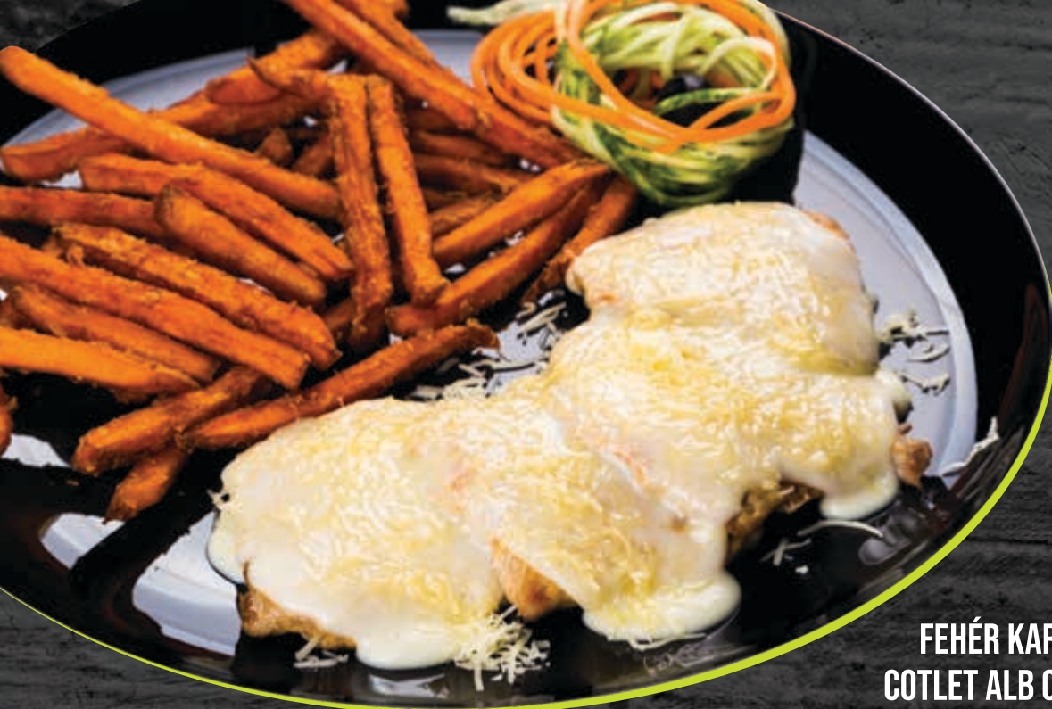
FEHÉR KARAJ SAJTMÁRTÁSSAL COTLET ALB CU SOS DE CAȘCAVAL ROAST PORK SPARE RIBS WITH CHEESE SAUCE