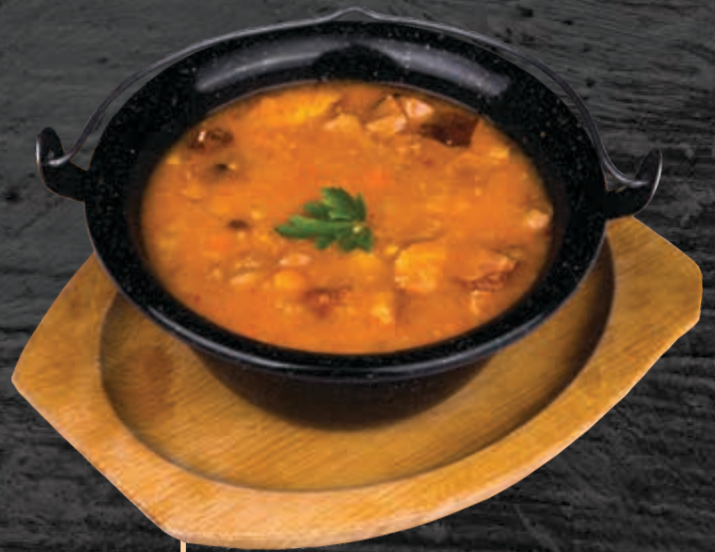
SZEMESPAZULYLEVES CIORBĂ DE FASOLE BOABE BEAN SOUP