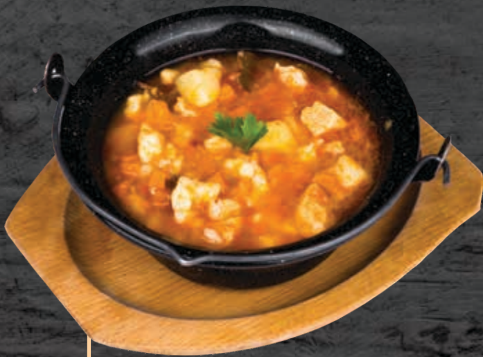
MAGYAR GULYÁSLEVES SUPĂ GULAȘ UNGURESC HUNGARIAN GOULASH SOUP