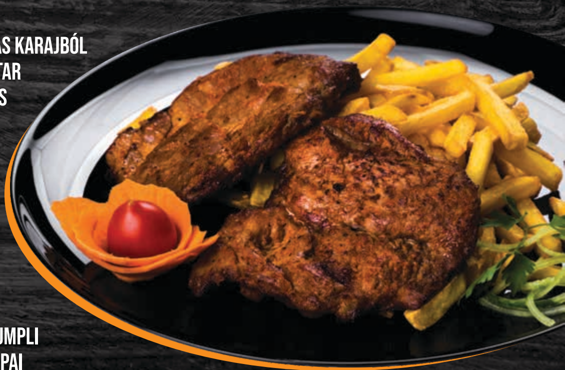
SÜLT KRUMPLI CARTOFI PAI FRENCH FRIES